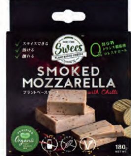
Sweets ヴィーガン グルメチーズ スモークト・モッツアレッタ with Chilli