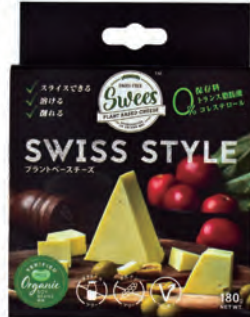
Sweets ヴィーガン グルメチーズ スイススタイル