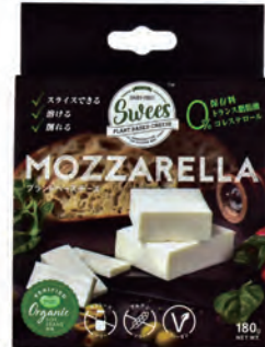
Sweets ヴィーガン グルメチーズ モッツアレッタ