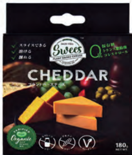
Sweets ヴィーガン グルメチーズ チェダー